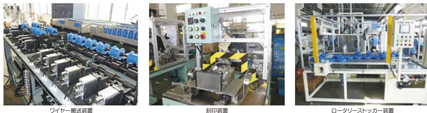
ワイヤー搬送装置