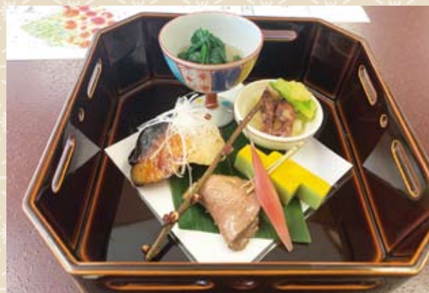
(嵐山辨慶 京懐石料理)

昼食は「嵐山辨慶」さんで、京懐石料理を堪能し、嵐山を観光散策いたしました。京土産で有名な「八つ橋作り体験」に挑戦