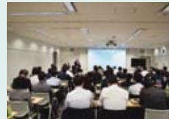
2月3日(月) 産機全体会議