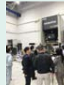
2月18日(火) 名古屋支店 プライベートショー