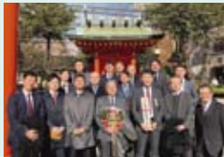
1月6日(月) 神田明神 東京支社商売繁盛・社運隆盛