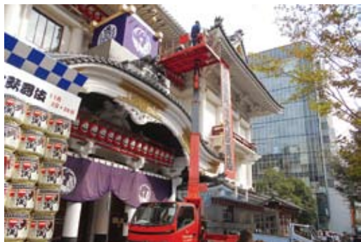
AT120SR (スーパーデッキ) 歌舞伎座高座取付作業