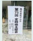
2月26日(水) 第73回定時株主総会