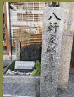
(八軒屋船着場跡地)

会社前の中大江公園東側中央には、上町台地から南へと熊野街道の起点として熊野三山巡礼者への道標があります。気づけばここかしこに悠久の歴史伝える場所が、点在しています。昼休にちょっと歩いてみると過去にタイムスリップするかもしれません。