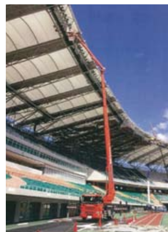
②某競技場天井作業中