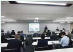
1月21日(火) 決算説明会 東京