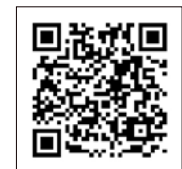
食パンの断裁工程 (2分19秒)