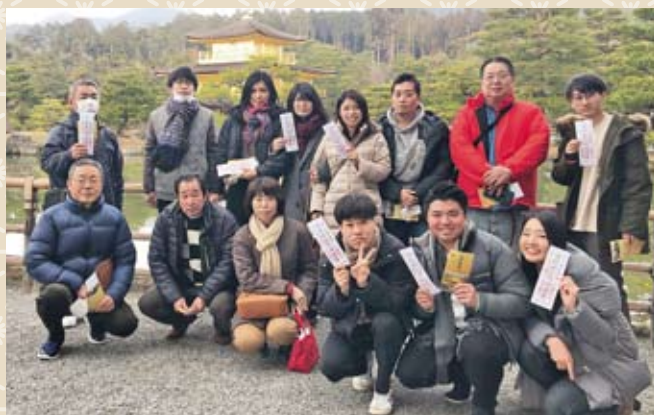
(世界遺産 金閣寺にて)

2月8日(土)、名古屋支店相互会にて京への濃い日帰り旅行を開催いたしました。お寺巡りは、世界遺産(文化遺産)室町時代の北山文化象徴である鹿苑寺(金閣寺)、枯山水の石庭のまぼろしで有名な龍安寺へ参りました。