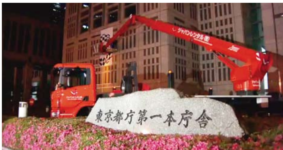
①東京都庁での東京オリンピック看板取付中

約5か月に及ぶ長期現場で競技場内の照明取り付け作業。写真で見てもわかるように、作業高ぎりぎりの現場で足場が組めないため、S56XRの能力を最大限活かした現場になりました。