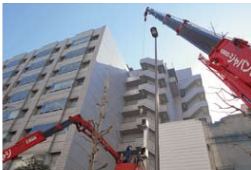
AT-195 (19.5m)・GR-120 (12t) 看板取付作業