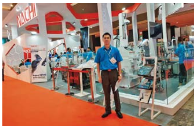
(12月4～7日 Manufacturing Indonesia (株)不二越ブースで接客中)

I think providing good service and business strategies will be easy ways for us to acquire trustworthiness and business opportunities continuously from our customers. I am hoping to continue providing the best service to the customers through good teamwork of Maruka Indonesia. I also wish and hope for our success together.