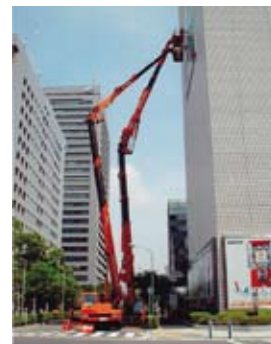
AT-500 (50m)・AT-400 (40m) 壁面看板取付作業