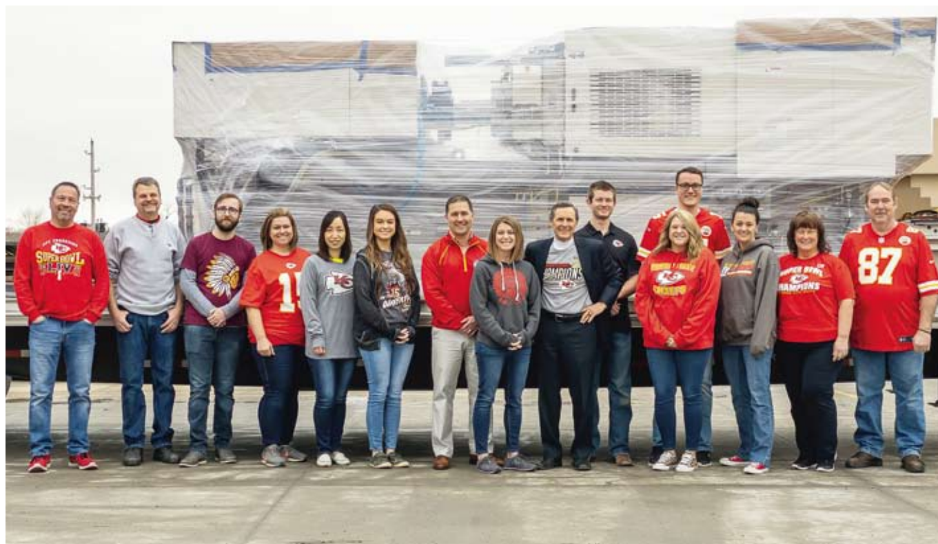
(マルカ・アメリカ社カンザスシティ本社 射出成形機出荷前にて)

NFLのカンザスシティ・チーフスが第54回スーパーボウルでの勝利をKCに運んでくれました。 KCに本社を置くマルカ・アメリカ社は、Unique Solutions とご満足をお客さまにお運びします。