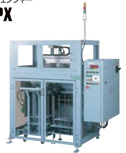
▶ 標準トレーチェンジャー TC-100PX