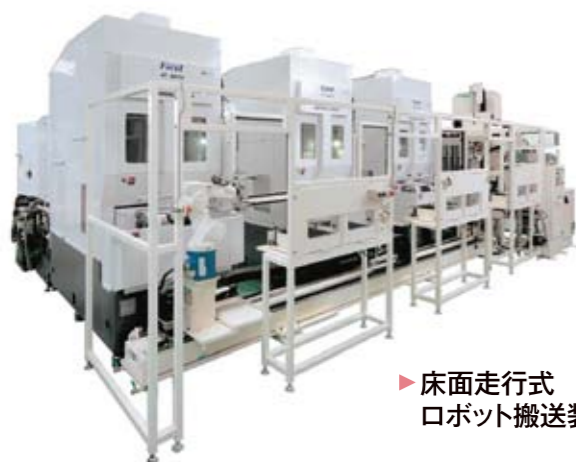
▶ 床面走行式 ロボット搬送装置