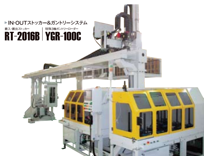
▶ IN-OUT ストッカー&ガントリーシステム 搬入・搬出ストッカー 特殊3軸ガントリーローダー RT-2016B | YGR-100C