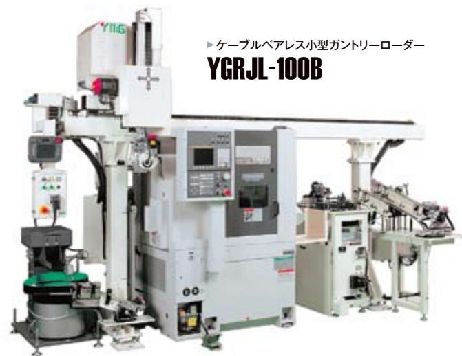
▶ ケーブルベアレス小型ガントリーローダー YGRJL-100B