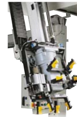
▶ サーボ旋回式 ダブルハンドユニット