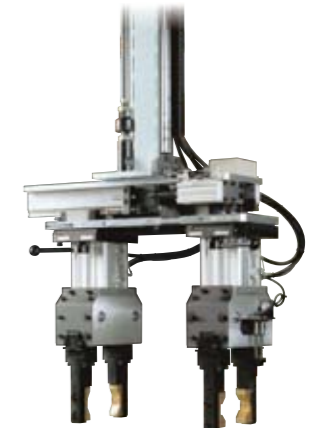
▶ ダブルハンドユニット