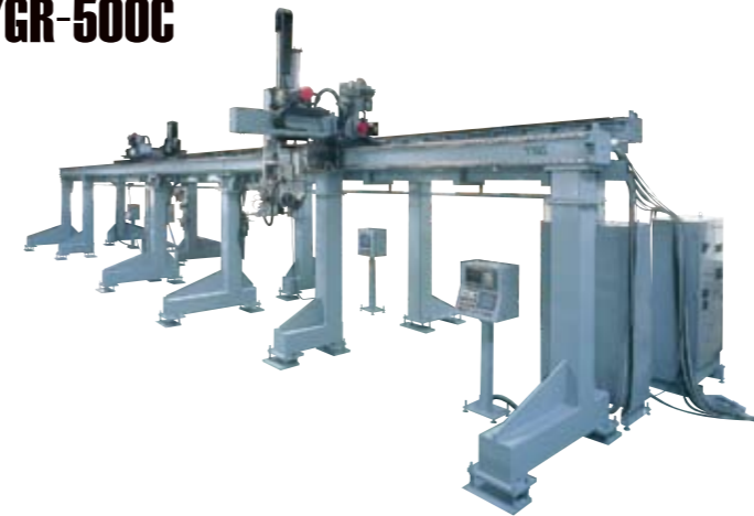
▶ 100kgワーク大型ローダー搬送システム 3軸ガントリーローダー YGR-500C