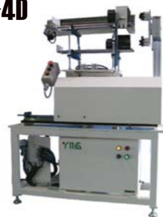
▶ スイングアーム式オートローダー SL700-4PS-4D