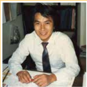
(アメリカ赴任2年目 1986年)