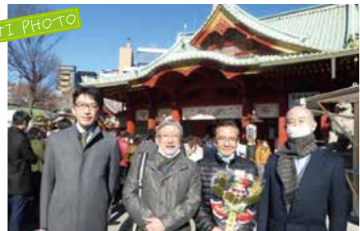
2022年1月5日(水)東京支社神田明神初詣