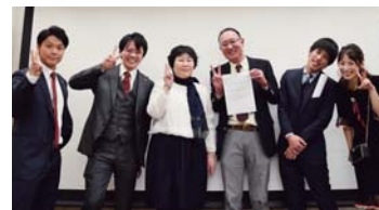
(2018年度特別貢献賞受賞)

企業において、「現場」が一番大切な場所だと思っております。何が求められているのかを知る為に現場に行き、何が必要なのかをしっかりと見据え、これからも行動してまいります。現場と経営陣の感覚を兼ね備えた言動で、マルカの経営基本目標である『個人の幸福・会社の繁栄・社会への貢献の三つが一致する経営』を追求してまいります。また、チャレンジ精神が旺盛で可能性に溢れた人財が、ワクワクしながらストーリーのある仕事を遂行し、活躍できるような組織・職場を維持機能させることが、最年少役員の私へ与えられた使命であると考えて取り組んでまいります。