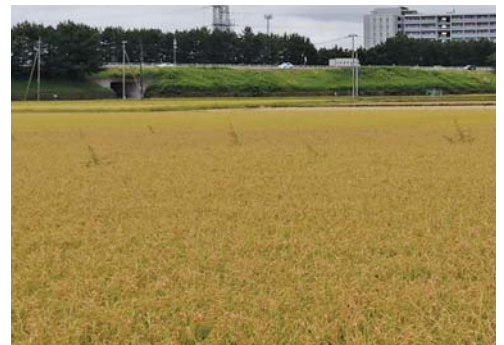
(堤防機能を備えた仙台東自動車道路若林地区景色 2020年9月27日)