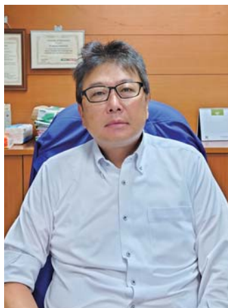
東南アジア統括本部長 マルカ・インドネシア社 社長

2月25日付で弊社執行役員に就任されました 両名の抱負をプロフィールとともにご紹介いたします