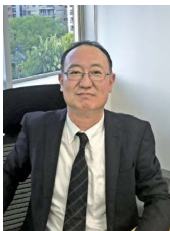
大阪産業機械第一部長