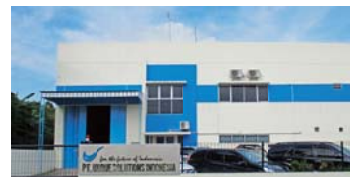
(PT.Unique Solutions Indonesia社)

最後になりますが、微力ながらマルカグループの業績に貢献できるよう尽力いたしますので、引き続き諸先輩各位ならびに社員の皆様のお力添えをいただけますよう、どうぞよろしくお願いたします。