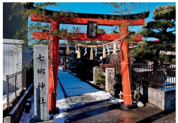
(七郷神社鳥居・雪の参道 2021年1月5日撮影)