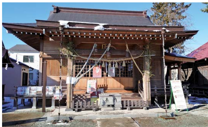
(七郷神社拜殿 2021年1月5日撮影)