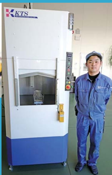
〈狙いシャワー洗浄機 KTS (Kan Tiny Sniper)〉