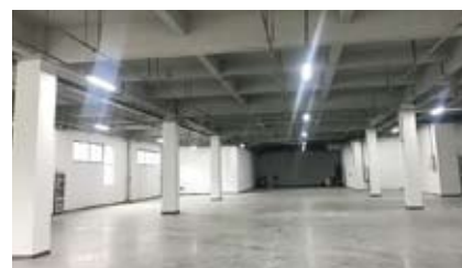
(設備展示室・部品倉庫)