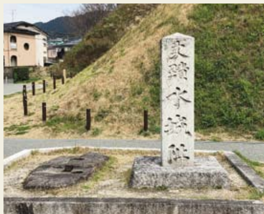
水城東門礎石跡地

大野城は、その翌665年に造られました。現在は築かれた礎石建物は残っていませんが、古代の山城の姿を彷彿させる、守りやすく攻められにくい山の地形を利用して造られた土塁・石塁の跡が残っています。その後、唐・新羅の連合軍が大和の国に攻めてくることはありませんでしたが、古人(いにしえ)の防人(さきもり)達の息遣いや緊張が、史跡から今でも伝わってくるようです。