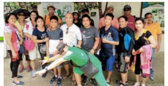
(2017年ボホール島でのFamily Day)

PM社は、仕事と楽しみが上手くバランスしている会社として1963年から歴史を刻んでおり、私はその一員であることをとても誇らしく思います。